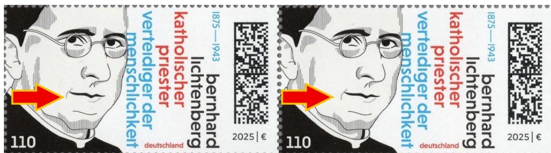
Abb. 3: Markenpaar mit „langem Mundwinkel“ auf beiden Marken