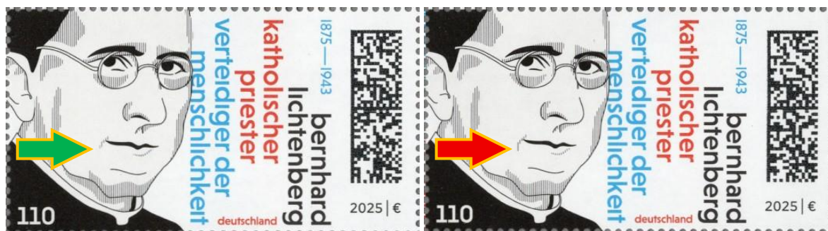
Abb. 1: Hauptunterscheidungsmerkmal „langer Strich im Mundwinkel“. Links die kurze Form, rechts die lange

Auffallendes Merkmal auf den Marken ist eine kurze oder lange Linie im linken Mundwinkel des Portraits Lichtenbergs. Die lange Linie lässt sich anhand weiterer Merkmale in zwei unterschiedliche Formen unterteilen.