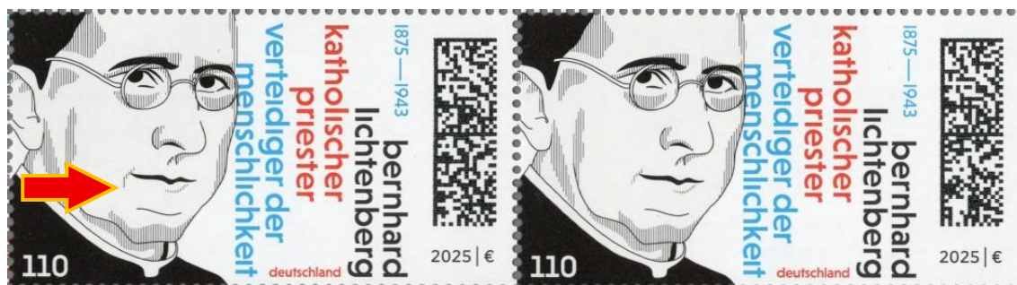
Abb. 2: Markenpaar mit „langem Mundwinkel“ auf der linken Marke

Die Besonderheit entwickelt sich weiter, indem Kleinbögen mit diesem Merkmal in unterschiedlichen Kombinationen auftreten können.