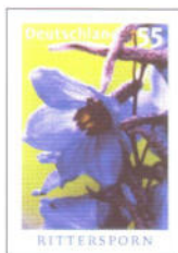
Axel Waldecker, Camera Uno