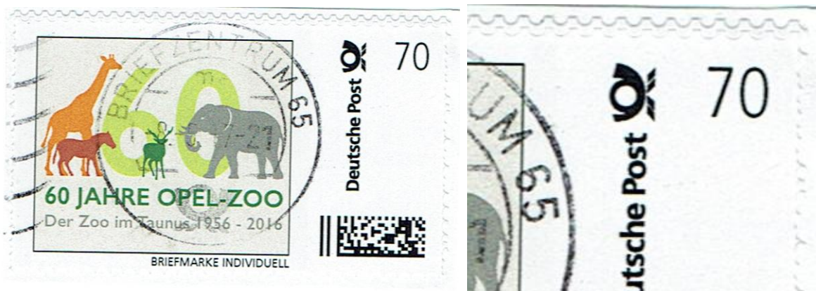
BMI 70cent „ 60 Jahre Opel-Zoo“ mit Doppelstanzung

Auffällig ist, dass durch den Höhenversatz der zweiten Stanzung von der senkrechten Stanzung nur noch Fragmente, kleine spitze Stummeln, übrig geblieben sind.