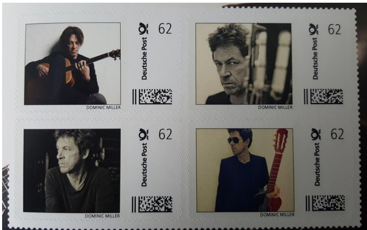
Komplette rechte Innenseite der PCI mit vier verschiedenen Motiven.

Die ausgelesene Matrix: DEAB00000000004007293577604 zeigt uns, dass es sich hier um einen Auftrag der DP AG handelt. Die Marke stammt aus einer PCI, welche mir mittlerweile zumindest als Abbildung vorliegt. Alle 4 BMI weisen die gleiche Beschriftung am Unterrand auf.