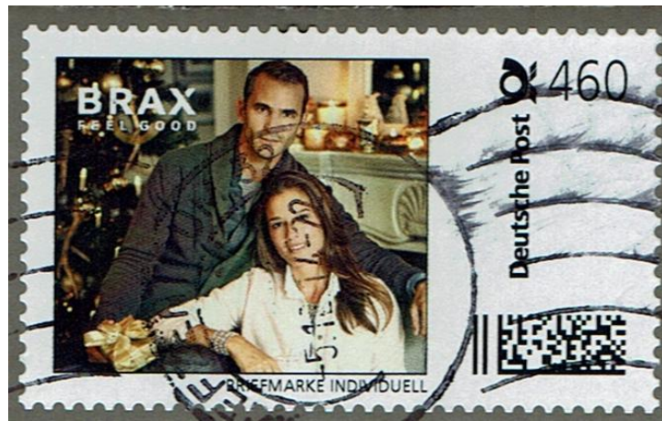
BMI in der seltenen Wertstufe 460 Cent