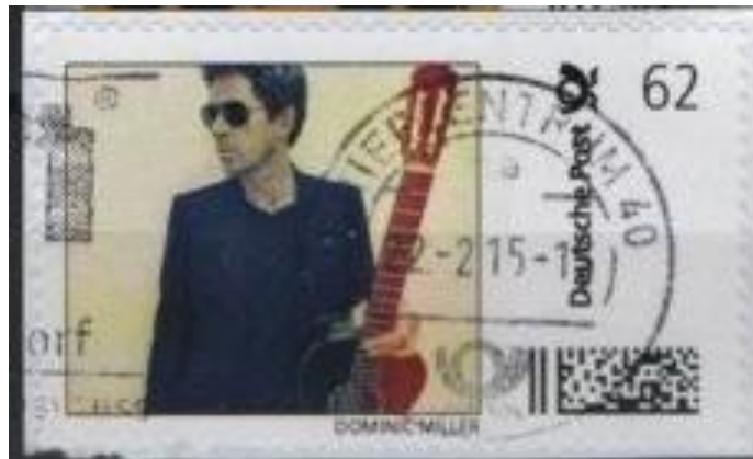
BMI „Dominic Miller“ aus einer PCI der DP AG

Die ausgelesene Matrix: DEAB00000000004007293577604 zeigt uns, dass es sich hier um einen Auftrag der DP AG handelt. Die Marke stammt aus einer PCI, welche mir mittlerweile zumindest als Abbildung vorliegt. Alle 4 BMI weisen die gleiche Beschriftung am Unterrand auf.